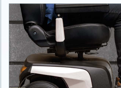
Columna de asiento reforzada